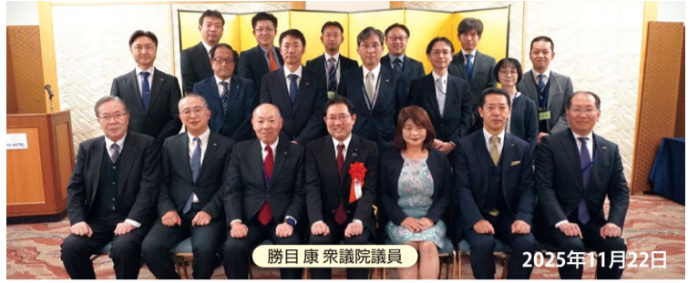
勝目康 衆議院議員