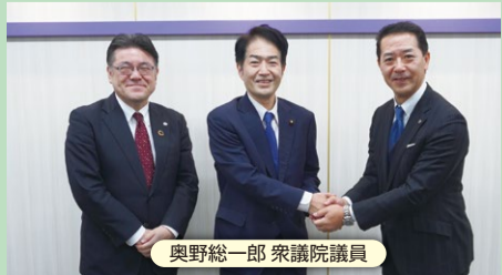
奥野総一郎 衆議院議員