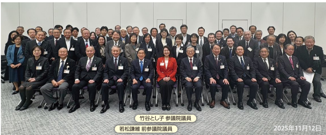
竹谷とし子 参議院議員