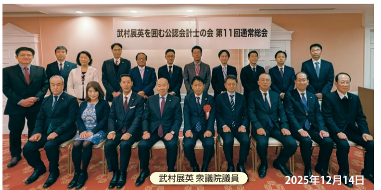
武村展英 衆議院議員