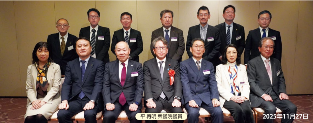
平将明 衆議院議員