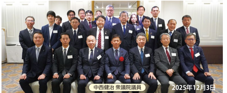
中西健治 衆議院議員