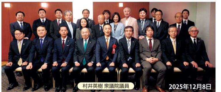
村井英樹 衆議院議員