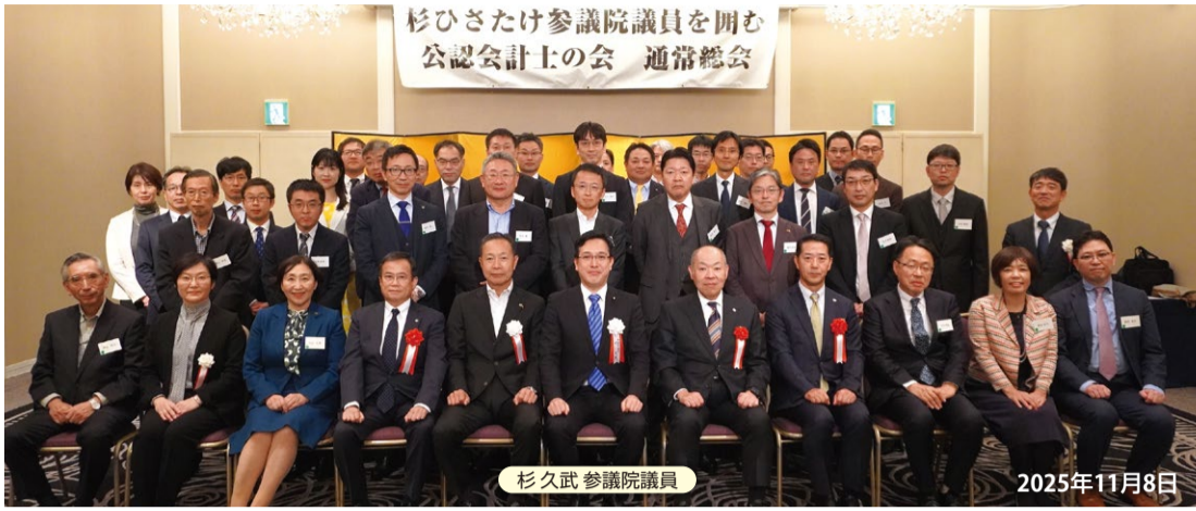
杉久武 参議院議員