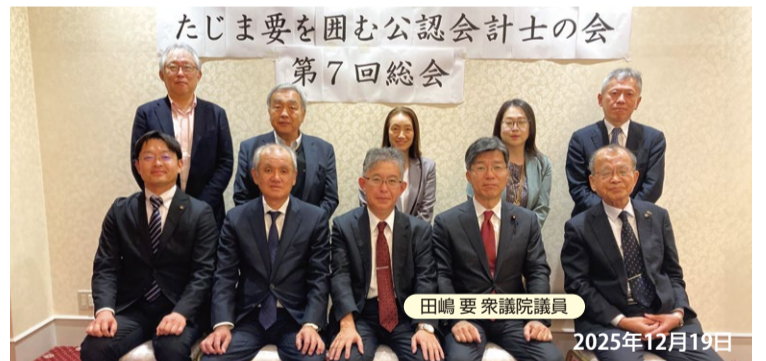
田嶋 要 衆議院議員