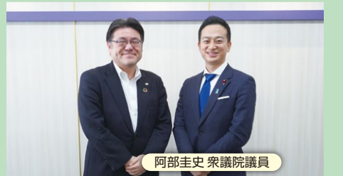
阿部圭史 衆議院議員